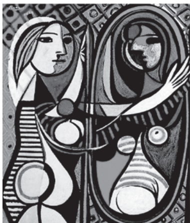
PICASSO, Pablo. Mulher no Espelho . Disponível em: < https://www.google.com/search?q=quadro+de+picasso+mulher+no+espelho&xsrf >. Acesso em: 13 dez. 2022.

Picasso foi pintor, escultor e desenhista espanhol, um dos principais artistas plásticos do século XX. Fundador do cubismo, ele rompeu com a estética da perfeição nas obras de arte, sendo, portanto, conhecido como o pintor da geometria.